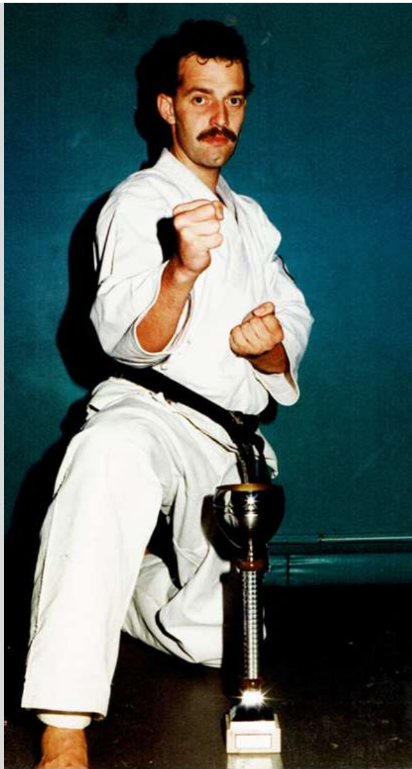
Vlaams kampioen 1989 (middengewicht)