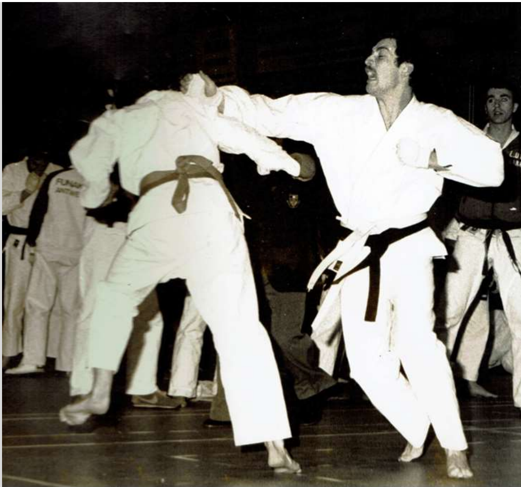
Vlaams kampioenschap per ploeg – 1980 (Kessel-Lo)

Als lichtgewicht kwam ik meestal uit tegen zwaardere kampers, wat zich meestal de dag nadien liet voelen. Erg veel wedstrijden stonden er niet op de jaarlijkse agenda. Deelnemen gaf het gevoel van naar het slagveld te trekken omdat de kans op een blessure vrij reëel was. Na de wedstrijd was het steeds ambiance en werd de avond afgerond met het traditionele etentje met gans de groep waar de wedstrijden nog eens haarfijn werden "geanalyseerd" wat dikwijls aanleiding gaf tot geanimeerde gesprekken.