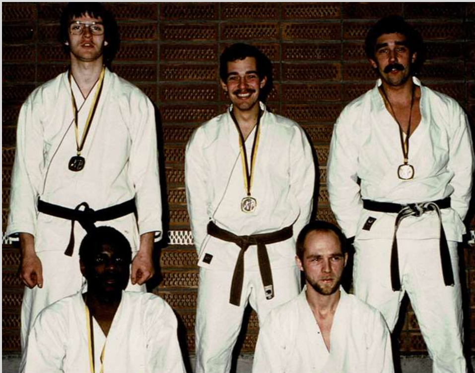
Vice-Vlaams kampioen per ploeg 1979