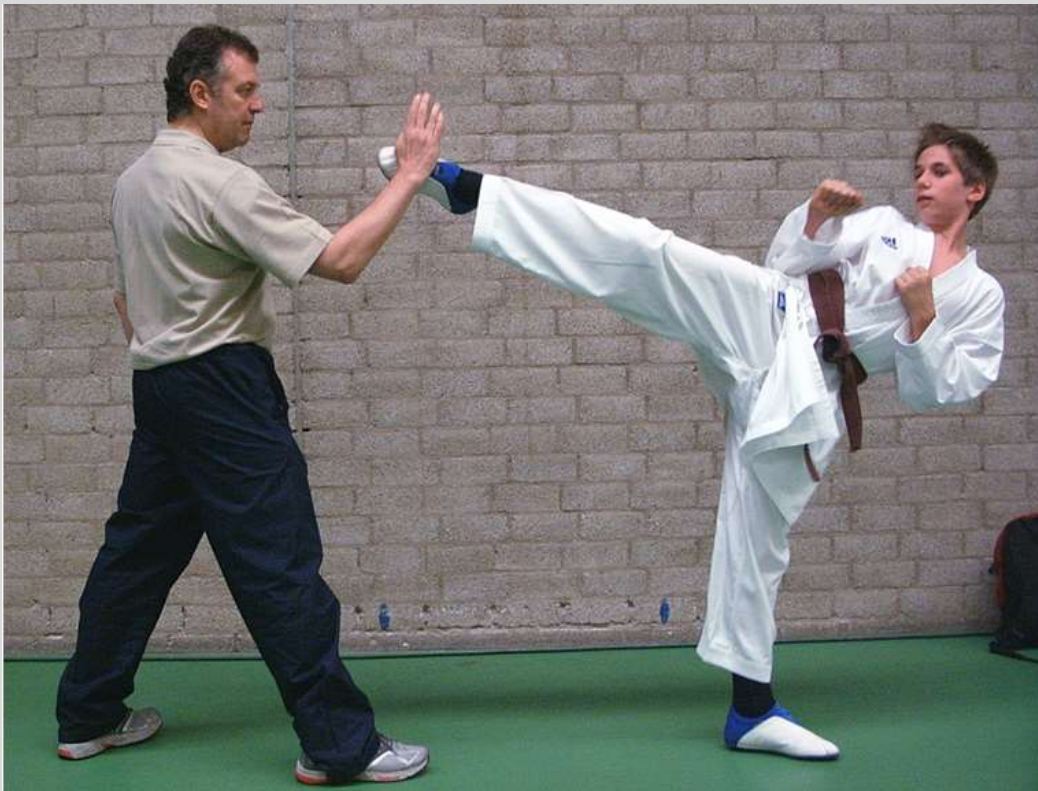
voorbereiding European Cup WIKF - Schiedam - 2006

Op latere leeftijd werd Rachid mijn vaste kumite trainer op donderdag.